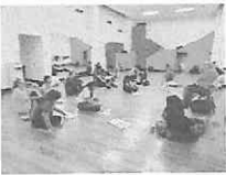
LECTURA ULTIMA ESCENA