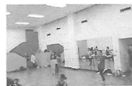
DELIRIO DE AMOR